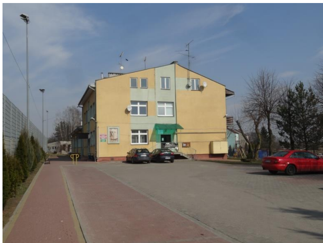
Gminne Przedszkole w Wąsewie

Wydatki na oświatę, to znaczna część budżetu Gminy. Źródła wydatków związanych z realizowaniem zadań oświatowych w Gminie to subwencja oświatowa, dotacje, środki własne gminy i inne.