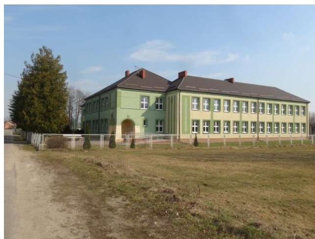
Publiczna Szkoła Podstawowa w Rzańniku

Przepisy określające zasady finansowania oświaty stanowią, że liczba uczniów jest podstawowym elementem podziału subwencji oświatowej w budżecie państwa. W niekorzystnej sytuacji stawia jednostki samorządu terytorialnego o podobnej strukturze jak Gmina Wąsewo, gdzie występuje duży obszar z niską strukturą zaludnienia.