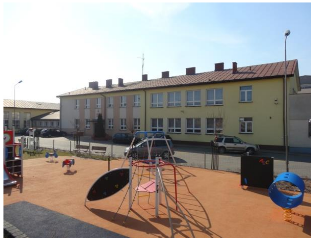
Publiczna Szkoła Podstawowa w Wąsewie