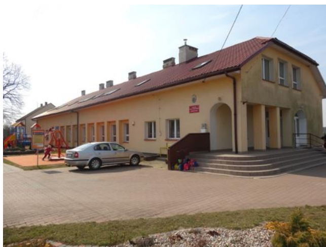
Publiczna Szkoła Podstawowa w Brudkach Starych